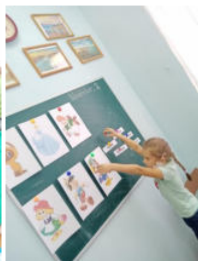
Приложение № 7