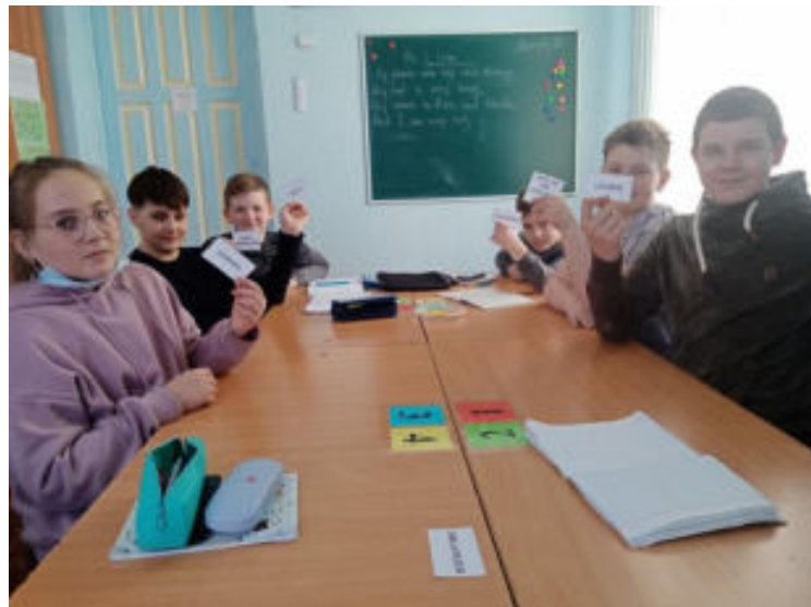
Приложение № 4