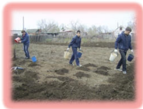
Волонтёры детского клуба «Исток» на уборке территории от мусора и оказывают помощь ветеранам в проведении садово-огородных работ