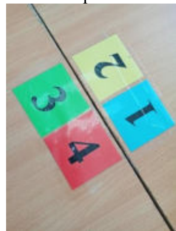
Приложение № 5