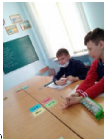
«Simultaneous Round Table»