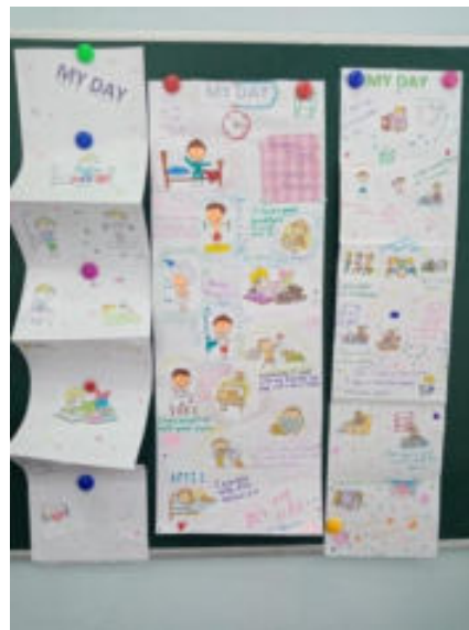
Приложение № 3