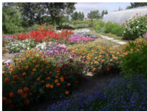
Работа на учебно-опытном участке развивает навыки и умения труда на земле