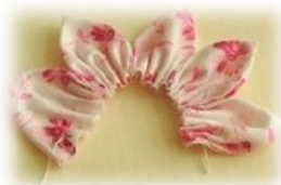
Схема изготовления цветка довольно проста. Из ткани выкраиваются «Лепестки», собираются иголкой на нитку, затем вместе собираются в цветок. А дальше зависит от фантазии автора: собрать все с помощью клея или проволоки, добавить аксессуары – бисер, бусины, перья и т.п.

Освоить этот потрясающий, истинно женский вид рукоделия может каждый, для этого нужно всего лишь набраться терпения, вдохновения и фантазии.